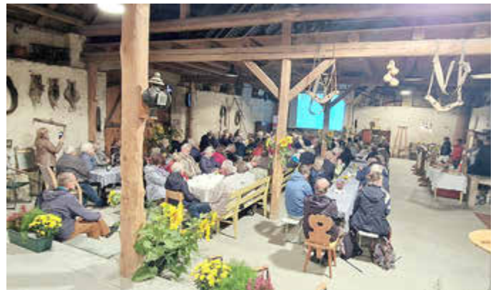
Vortrag in der Pfarrscheune