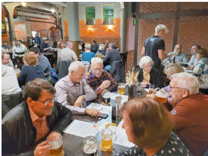
Ausflug nach Varnsdorf

Der Oktober startete mit dem Tag der Einheit in ein ereignisreiches verlängertes Wochenende. Der Maltitzer Ackertag ist schon zu einer festen Größe im Kalender geworden und wurde wieder von vielen Gästen besucht. Einen Bericht finden Sie in dieser Ausgabe.