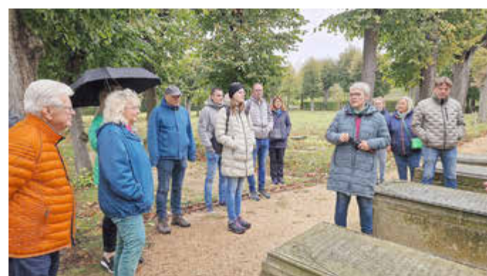
Grabstätte von Zinzendorf in Herrnhut.