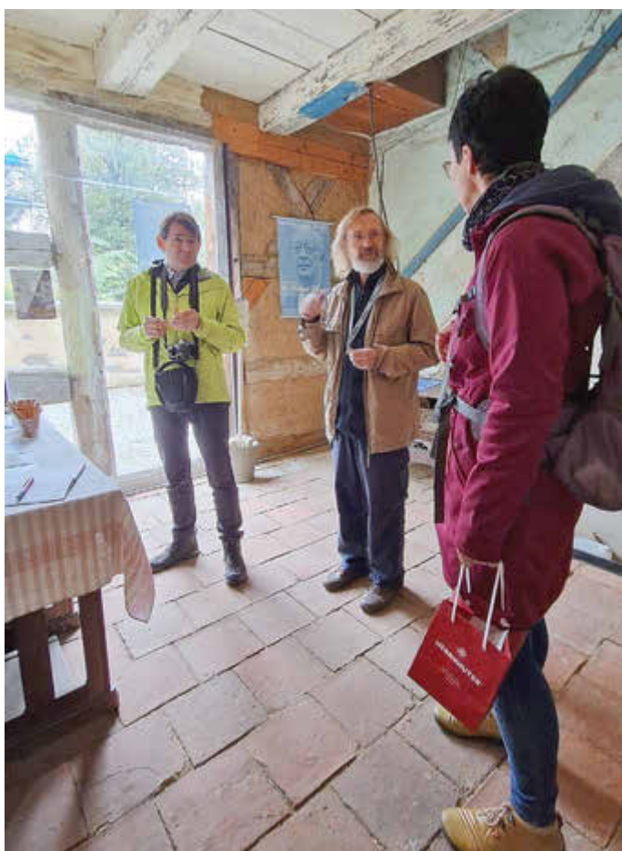
Besuch der Alten Kirchsule