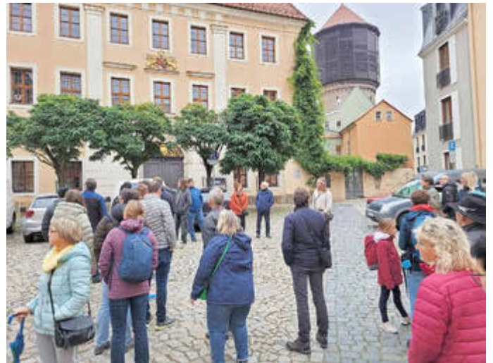
Stadtführung in Bautzen