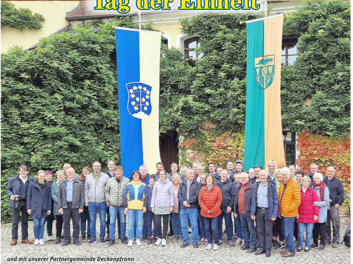
und mit unserer Partnergemeinde Deckenpfronn