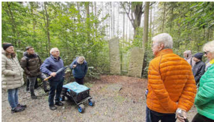
Wanderung in Herrnhut