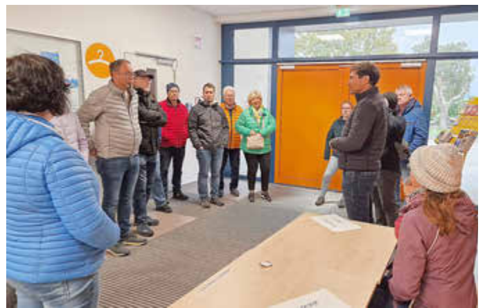
Zu Gast in der Freien Oberschule