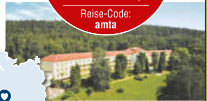
Beispiel Doppelzimmer Komfort