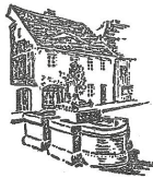
Einziges technisches Museum des Pfefferkühlhandwerks in Europa

im Museum „Alte Pfefferkühlerei“ Weißenberg vorerst keine regulären Öffnungszeiten angeboten.