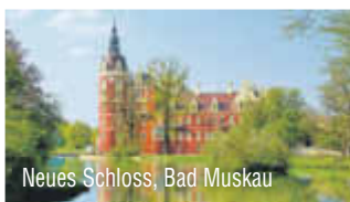
Neues Schloss, Bad Muskau