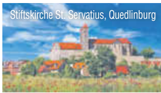
Stiftskirche St. Servatius, Quedlinburg