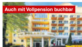
Auch mit Vollpension buchbar