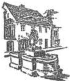
Einziges technisches Museum des Pfefferkühlerhandwerks in Europa

Das Museum hat zu den üblichen Öffnungszeiten wieder geöffnet und freut sich über Ihren Besuch.