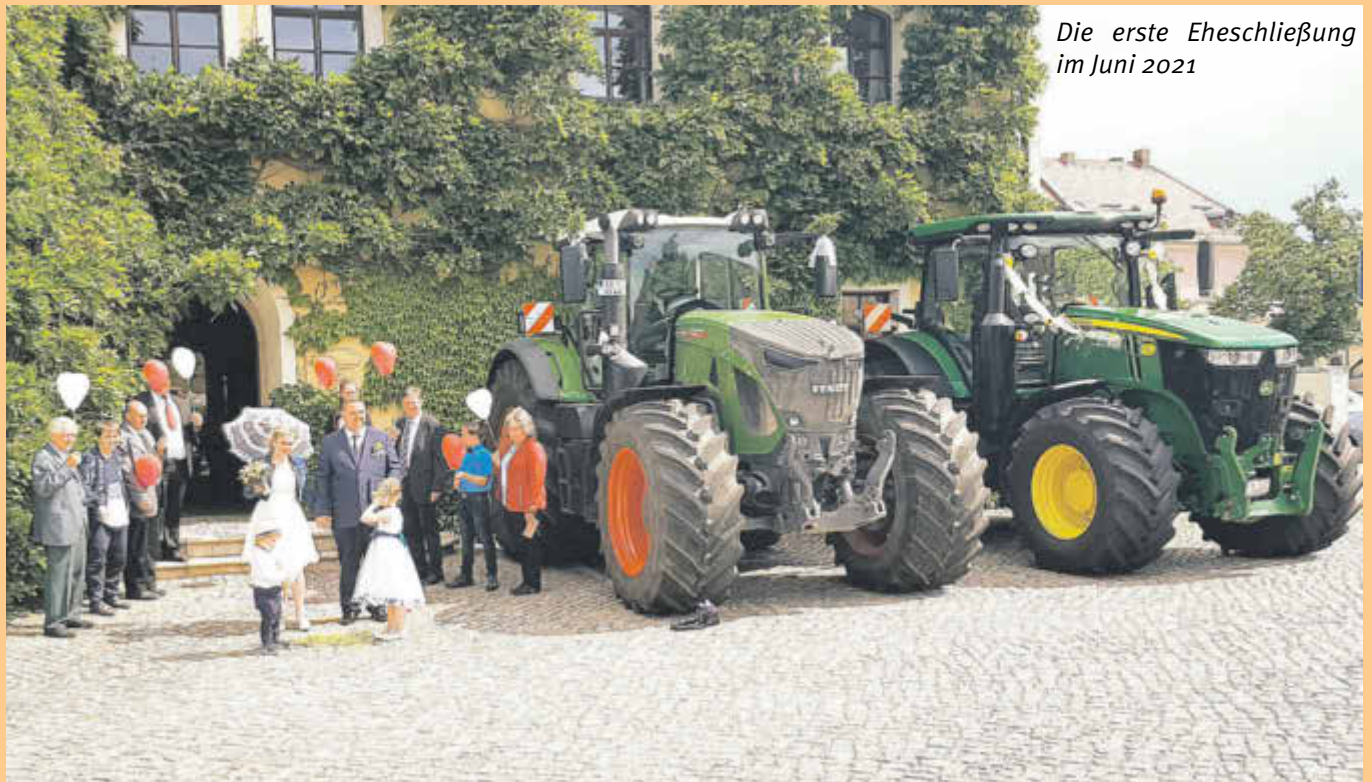
Die erste Eheschließung im Juni 2021

In den letzten Monaten waren gute Nachrichten für uns alle leider ziemlich rar. Corona und die damit verbundenen Einschränkungen haben jeden von uns sehr beeinträchtigt. Unter anderem traf es auch im besonderen Maße die Heiratswilligen. Abhängig von den Inzidenzwerten wurden im Bereich der Eheschließungen stets neue Maßgaben auferlegt. Eine sichere und langfristige Planung war für die Brautpaare nicht möglich. Aus diesem Grund entschieden sich viele Paare, von einer Trauung zu Corona-Zeiten abzusehen. Und so blieb es in unserem Trauzimmer im Rathaus oder auch im Schloss Gröditz bisher ziemlich ruhig.