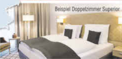
Beispiel Doppelzimmer Superior